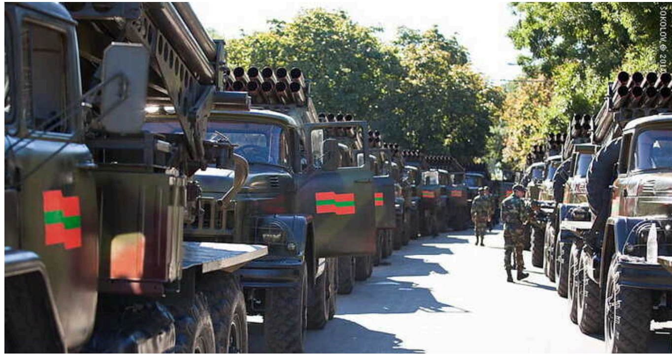
РФ у Придністров'ї створює інформаційні приводи для дестабілізації Молдови – ISW

У підтримуваному Росією Придністров'ї створюються інформаційні умови для можливої операції під фальшивим прапором. Це робиться в рамках зусиль Кремля з дестабілізації Молдови.