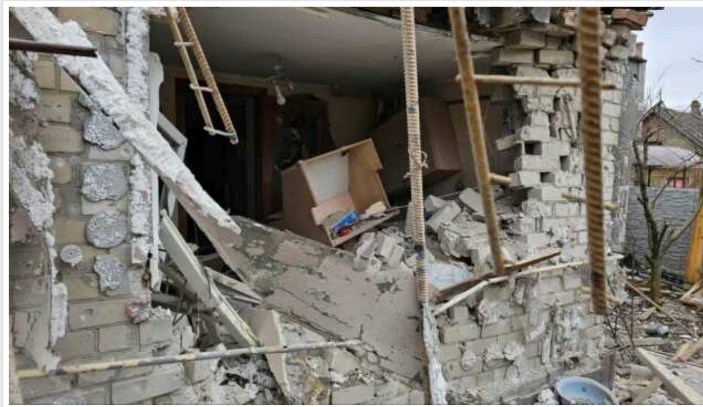
Окупанти за добу 71 раз обстріляли Херсонщину: є загиблі

Протягом минулої доби російські загарбники вчинили 71 обстріл Херсонської області, загинули дві людини.