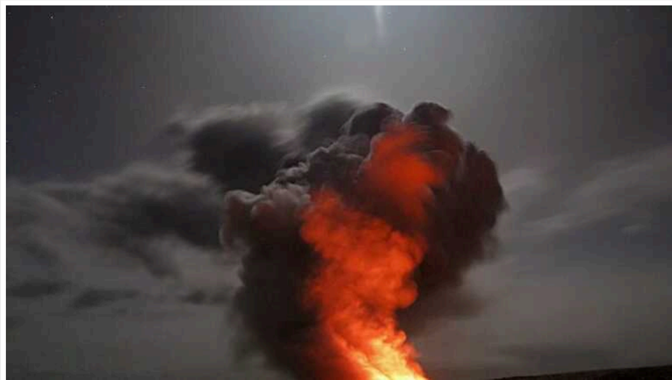
У Дніпрі чутно вибухи

У Дніпрі було кілька вибухів. Повітряні Сили попереджали про загрозу ракети "Кинджал"