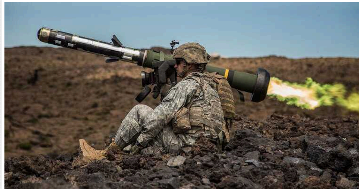
Загарбники на БМД-4 потрапили в пастку «Javelin»: особовий склад спаленої техніки знищили

Окупанти потрапили в пастку українського підрозділу протитанкістів. Наші військові знищили БМД-4 з Джавеліну, а далі ліквідували весь особовий склад ворога.