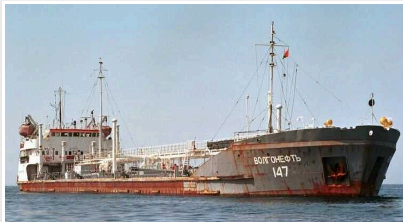
Хусити помилково атакували російський танкер із нафтою

Бойовики-хусіти помилково потрапили до російського танкера, який перевозив нафту біля берегів Ємену. Як відомо, це не перший випадок помилкової атаки.