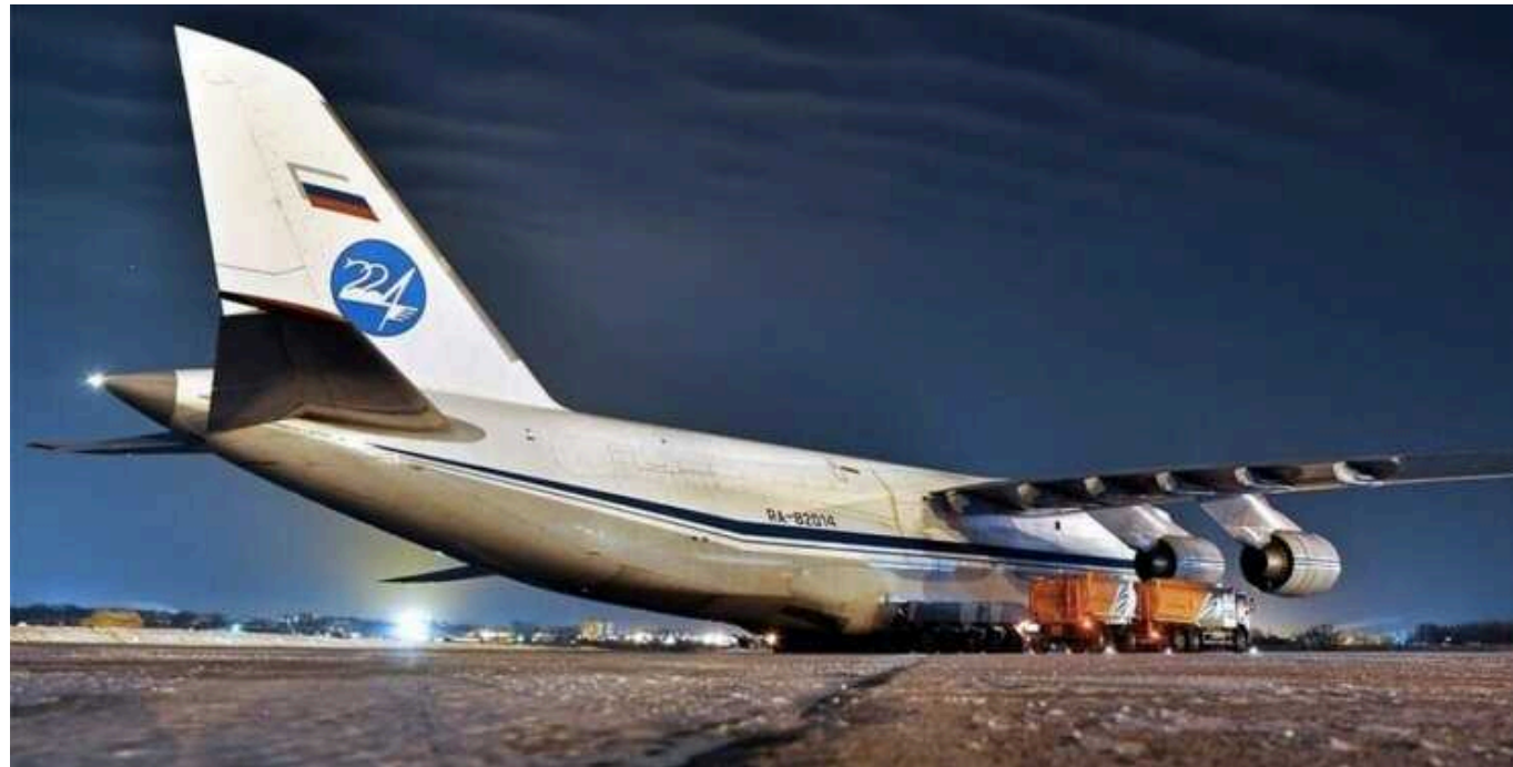
До постачання ракет КНДР може бути причетний льотний загін Путіна, — ЗМІ