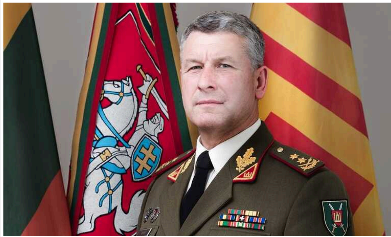
У Литві підготували план створення піхотної дивізії на випадок війни

Литва до 2030 року має створити легку піхотну дивізію. Разом із двома іншими підрозділами НАТО вона буде потрібна на випадок війни.