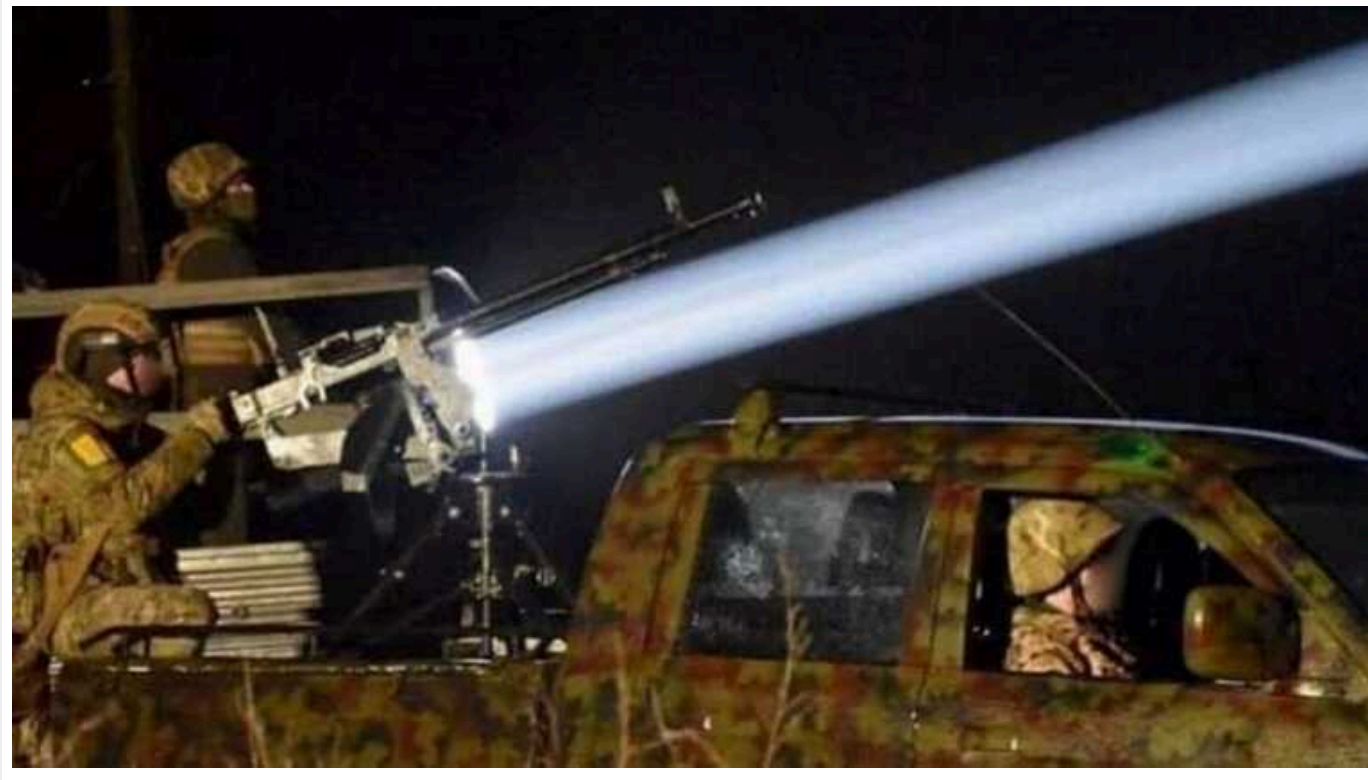
На Київщині працюють сили ППО

На Київщині працюють сили протиповітряної оборони сьогодні пізно ввечері, 12 січня.