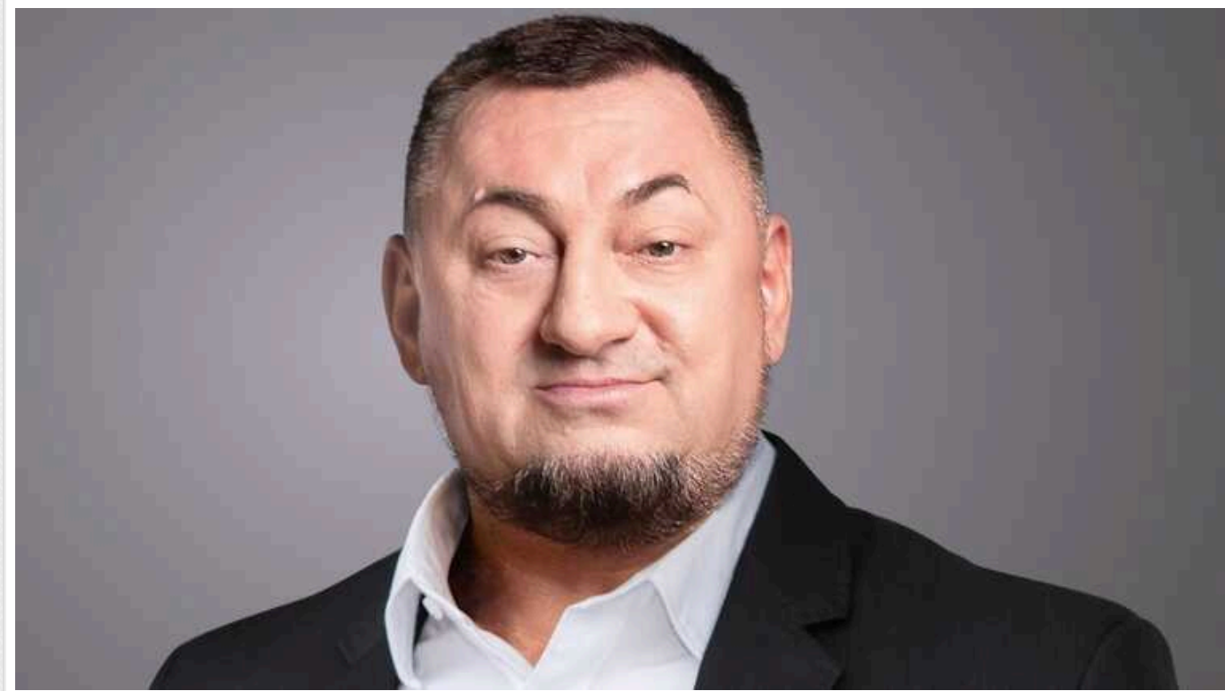
Нардеп Герега платив зарплату депутату від "Единой России": в ОГП не побачили в цьому злочину

За даними журналістів, те, що нардеп виплачував зарплату депутату від "Єдиної Росії" Геннадію Гальчуку, не свідчить про вчинення злочину.