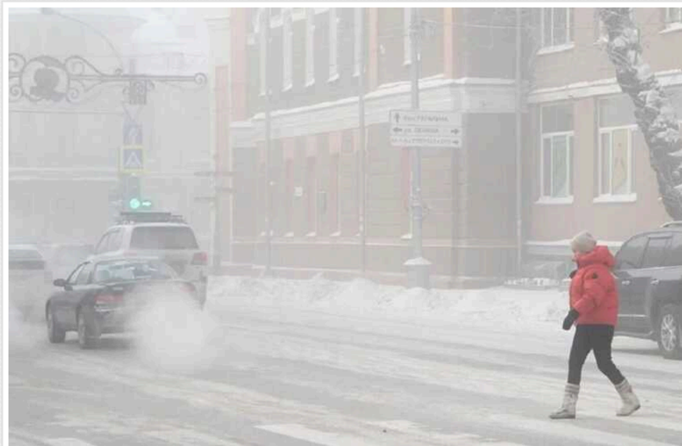
Спливли несподівані дані про проблеми в Росії: Карелія замерзає через відомство Шойгу?

Хвиля аварій, унаслідок яких у Росії без опалення залишаються цілі міста, докотилася до Карелії: там нині замерзають жителі кількох населених пунктів. При цьому причиною теплового "колапсу" став той факт, що десятки джерел теплопостачання на території Карелії експлуатують підрозділи житлово-комунального управління, підпорядкованого міністерству оборони РФ.