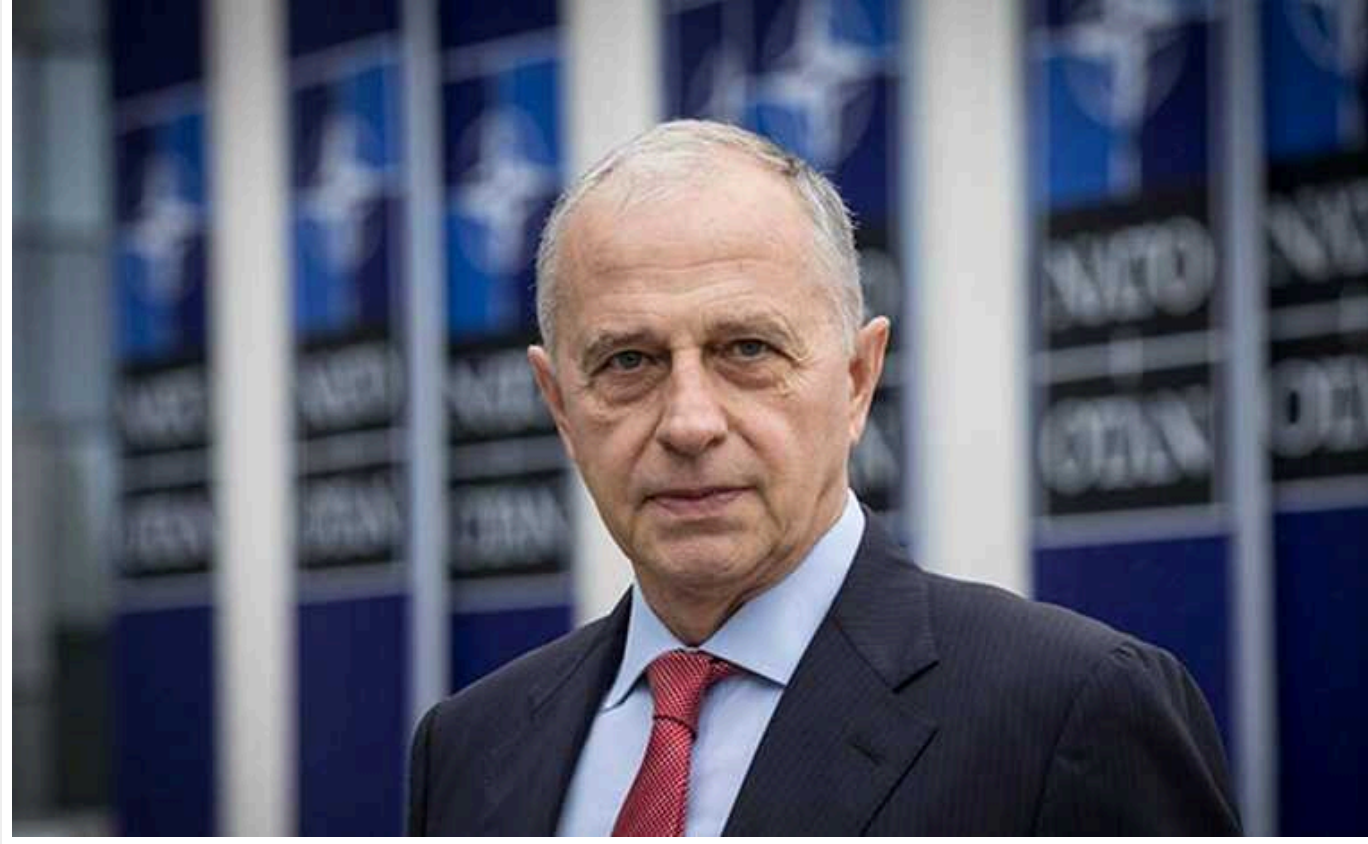
У НАТО припустили, що війна в Україні не закінчиться навіть 2025 року

Слід готуватися до того, що війна Російської Федерації проти України триватиме ще довго і, можливо, не закінчиться навіть 2025 року.