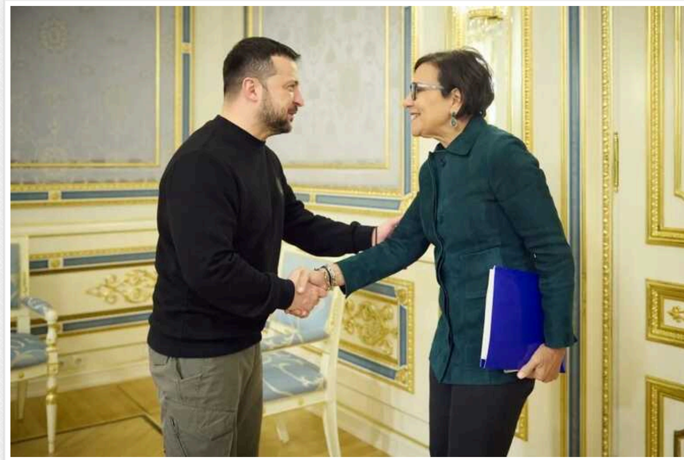
Зеленський зустрівся зі спецпредставницею США з питань економічного відновлення України Пріцкер

Президент України Володимир Зеленський зустрівся зі спецпредставницею США з питань економічного відновлення України Пенні Пріцкер. Цей візит є потужним сигналом міцної підтримки нашої держави.