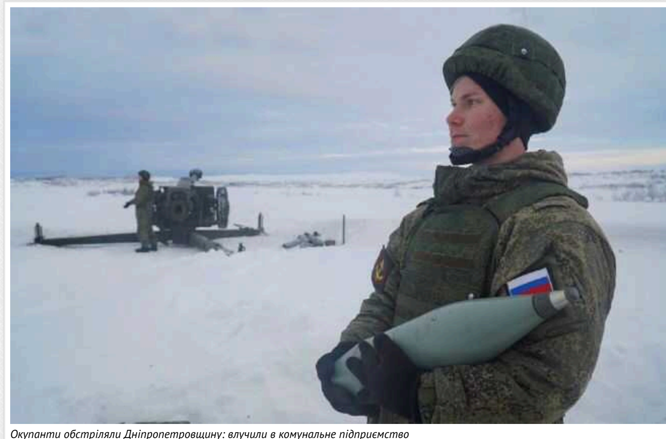
Окупанти обстріляли Дніпропетровщину: влучили в комунальне підприємство

У п'ятницю, 12 січня, російські окупаційні війська знову обстрілювали Дніпропетровську область. Тричі за день ворог бив по Нікополю з артилерії, у місті пошкоджено комунальне підприємство.