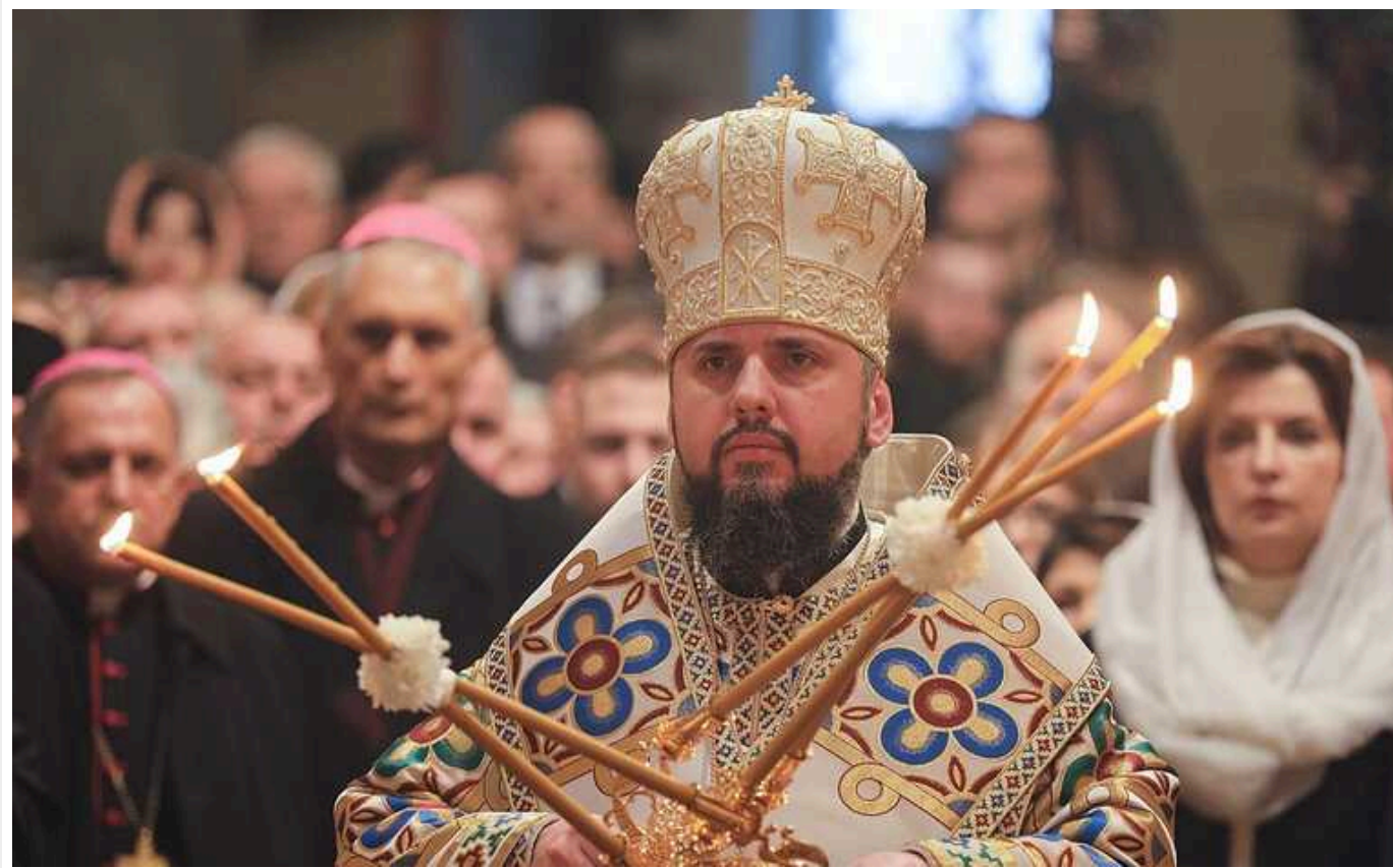
Епіфаній розповів, скільки парафій ПЦУ святкували Різдво 25 грудня

99% вірян Православної церкви України після запровадження календарної реформи відзначали Різдво 25 грудня 2023 року, а не 7 січня 2024.