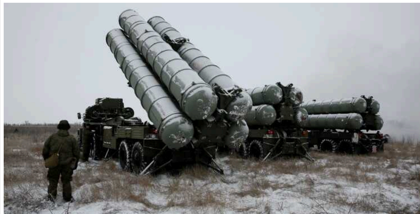
РФ активізувала повітряну війну проти України, – Київський безпековий форум

Противник почав модернізувати ракети й БПЛА, якими в результаті атакує мирні міста. Україна, зі свого боку, має врахувати це та виробити нову стратегію.