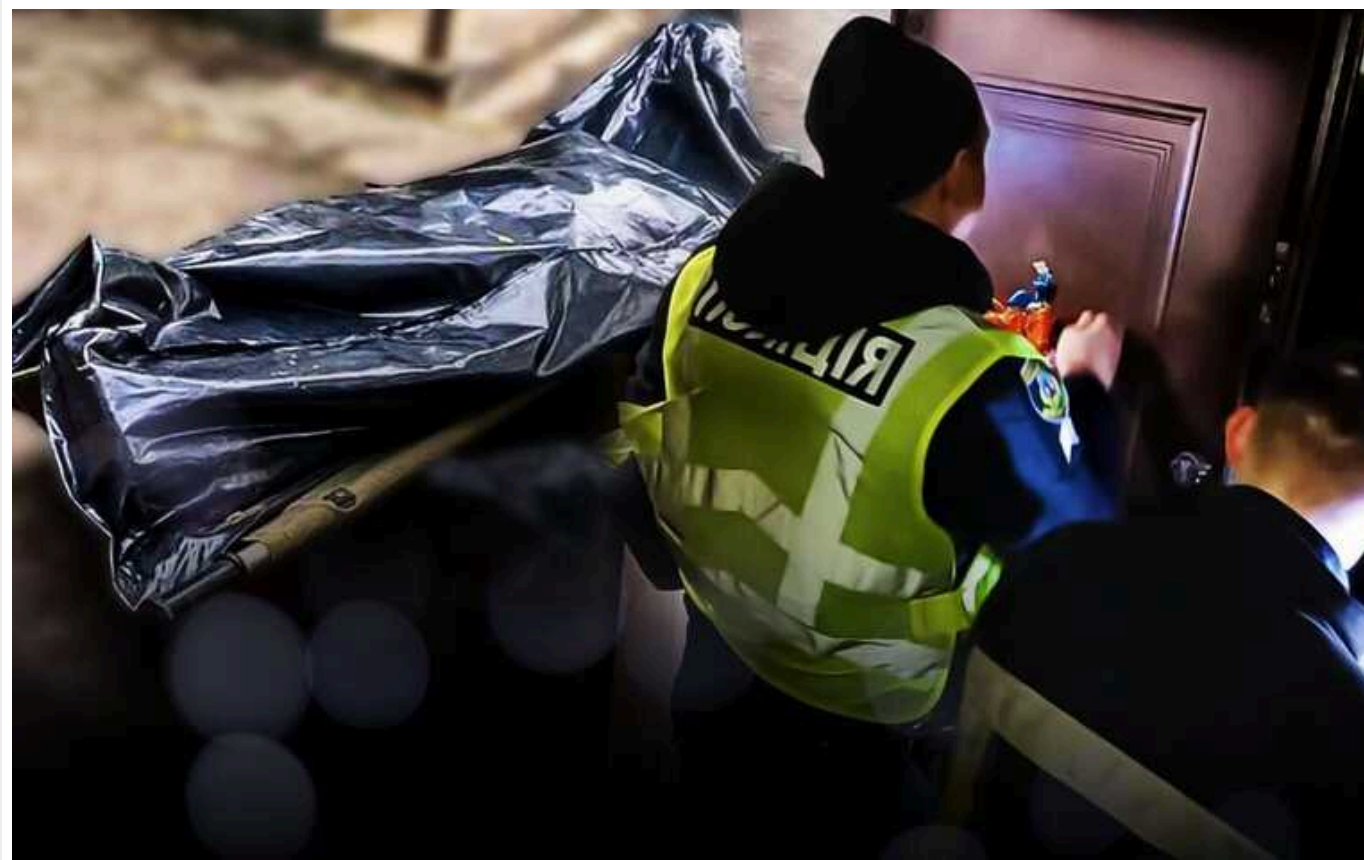
Загадкова смерть ексзаступниці генпрокурора: з'явилися нові деталі

Загадкова смерть ексзаступниці генпрокурора та її доньки. У поліції зробили гучну заяву! Що могло стати причиною смерті та які версії розглядає слідство?