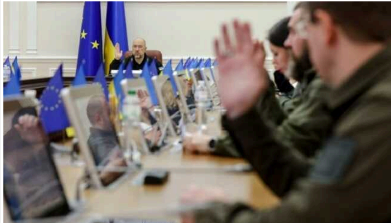
Кабмін додатково виділив майже 2,5 мільярда гривень на інженерно-технічні та фортифікаційні споруди

Для посилення обороноздатності України Кабінет Міністрів виділив додатково майже 2,5 млрд грн на будівництво інженерно-технічних і фортифікаційних споруд.