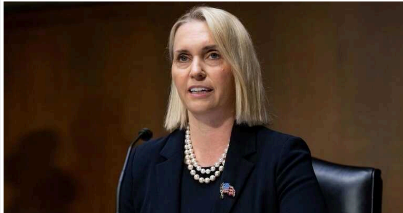
США провели вже два раунди переговорів з Україною щодо зобов'язань у сфері безпеки, – Бріджіт Брінк

Пані посол Сполучених Штатів в Україні Бріджіт Брінк, коментуючи новину про підписання такого документа з Великобританією, заявила, що США прагнуть підписати з Україною договір безпеки.