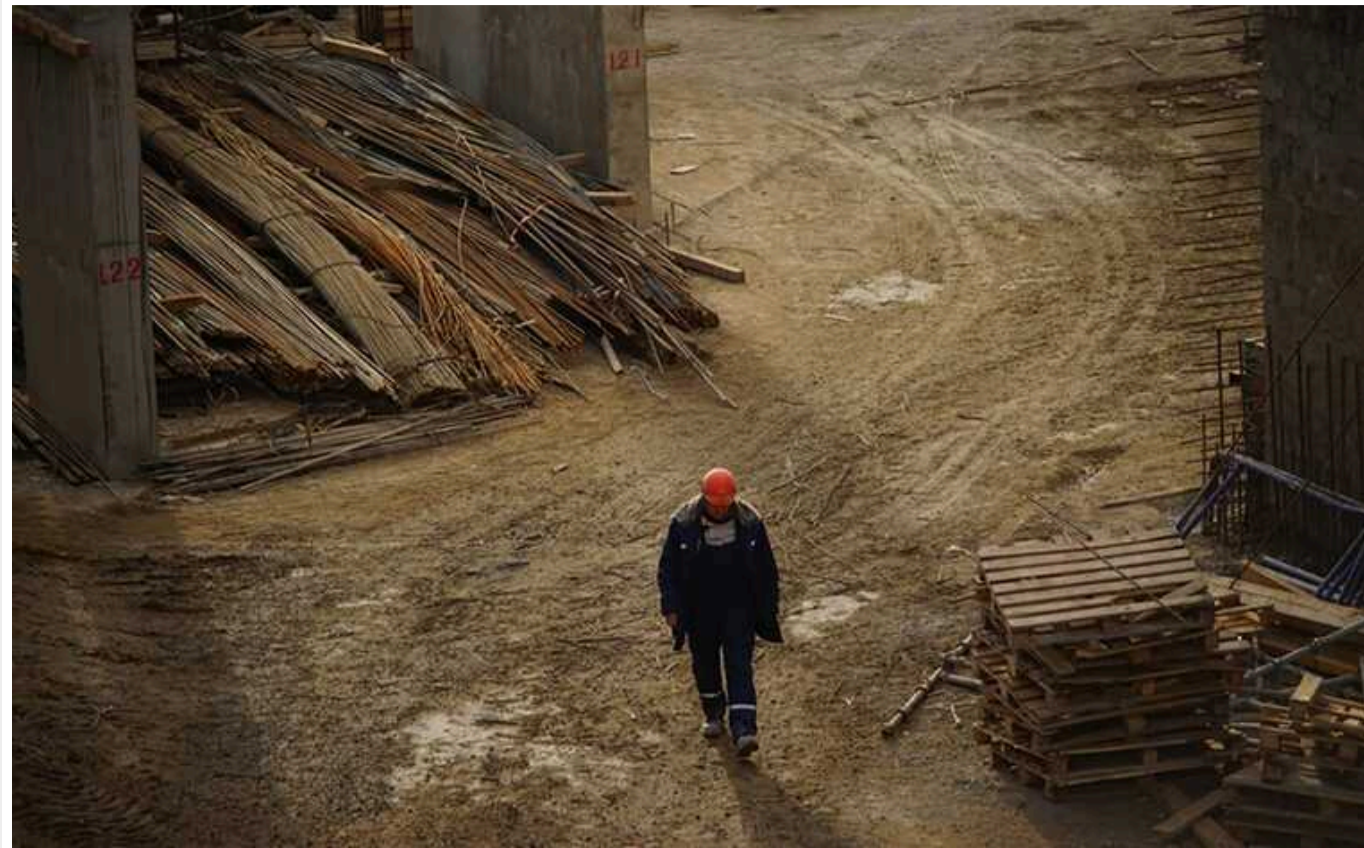
Жителям Прикарпаття пропонують роботу в Донецькій області: необхідно зводити фортифікаційні будівлі

В Івано-Франківській області мешканцям пропонують роботу на Донеччині. Потрібно будувати фортифікаційні споруди. Робітники отримають відстрочку від мобілізації.