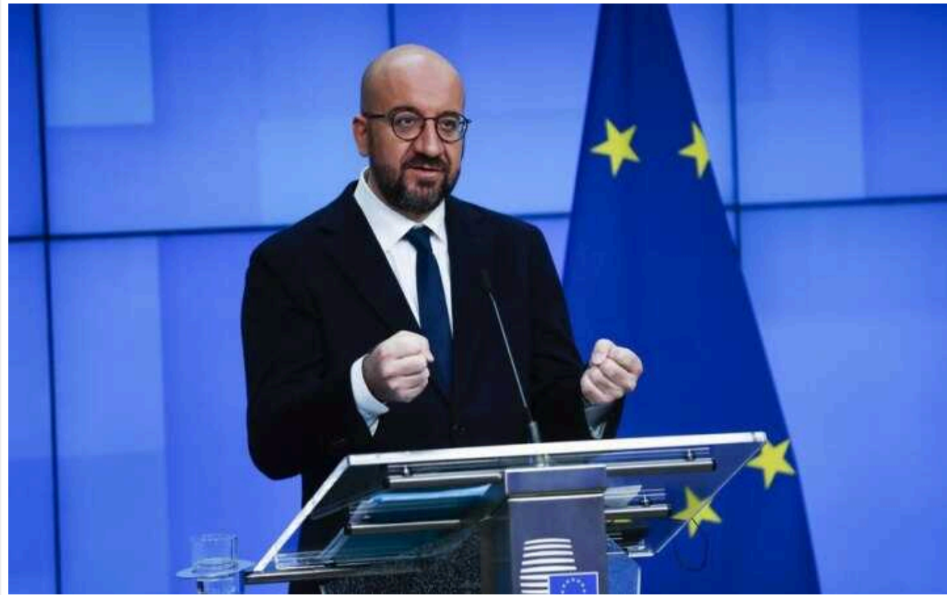
В Євросоюзі розкритикували рішення Мішеля піти у відставку, – Politico

Європейські дипломати та офіційні особи розкритикували рішення президента Європейської ради Шарля Мішеля піти у відставку та балотуватися до Європарламенту. У разі обрання він планує зайняти своє місце в Європейському парламенті у середині липня – задовго до закінчення терміну його повноважень президента Євроради, який закінчується в листопаді.