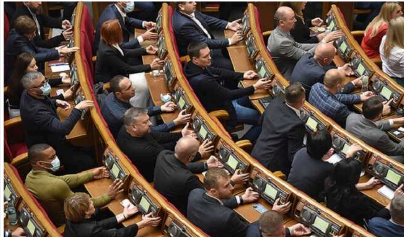
Законопроект про реєстр військовозобов'язаних підготували до другого читання

У прикладену таблицю включено 172 сторінки з 415 поправками.