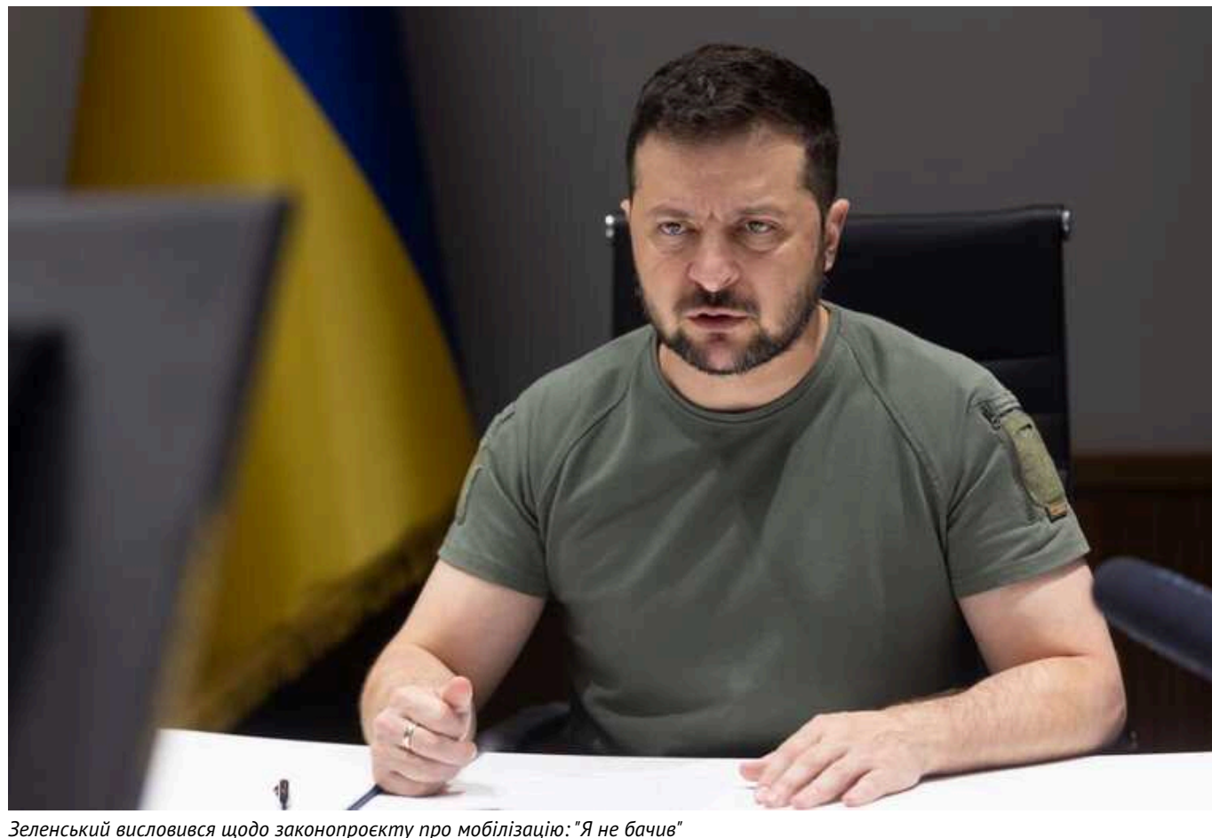
Зеленський висловився щодо законопроекту про мобілізацію: "Я не бачив"

За словами глави держави, законопроект про мобілізацію має бути справедливим. Президент також зазначив, що ще не ознайомився з кінцевим варіантом документа.