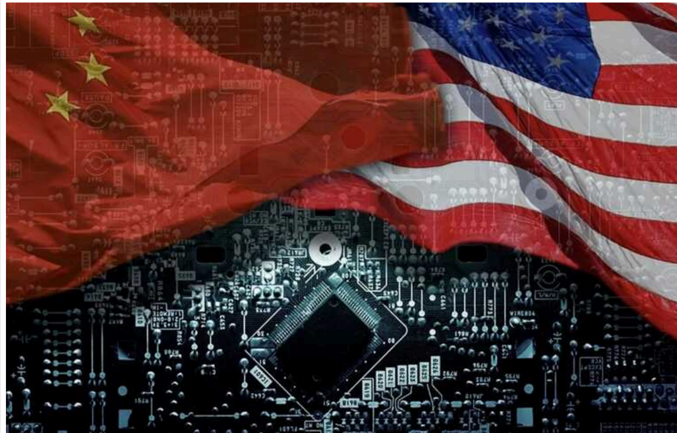
Санкції США не працюють: за прогнозами аналітиків Китай робитиме у 2 рази більше чипів уже через 5 років

Аналітики Varclays прогнозують зростання виробничих потужностей китайського техносектору на 60% у найближчі 3 роки.