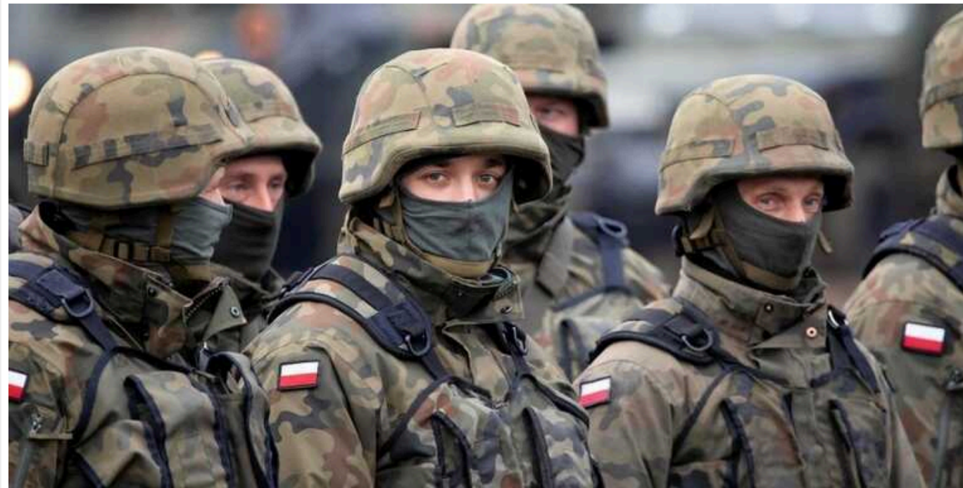
В армії Польщі викрили проросійську мережу: готували держпереворот

Членів Асоціації звинувачують у підбурюванні до вбивства одного з генералів, роботі на розвідку інших країн та спонуканні військовослужбовців Війська Польського до відмови від виконання службових обов'язків.