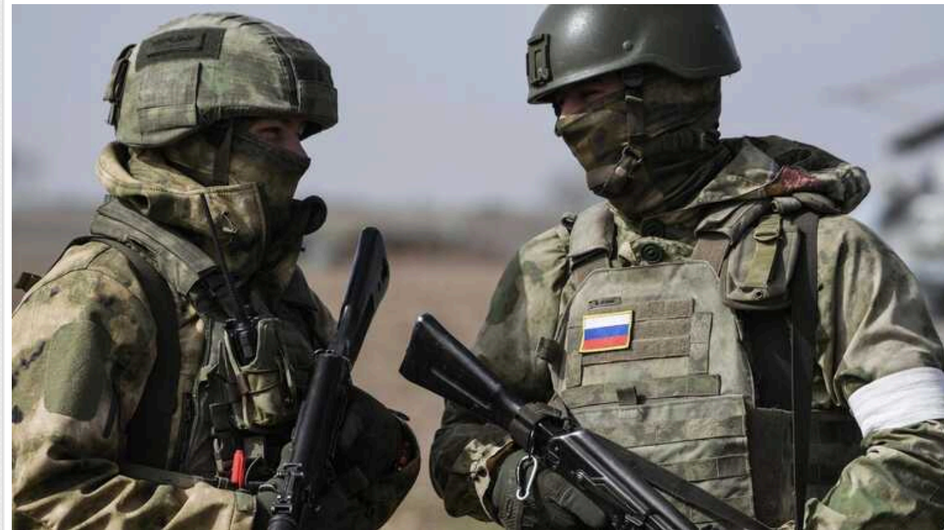
В українських пабліках з'явилося відео, на якому окупанти показують свої укріплення

Видно розгалужену траншейну систему, довжиною сотні метрів, глибиною до 2 метрів і шириною до 1,5 метра, що дозволяє вільно пересуватися і легко розминутися двом бійцям у спорядженні.