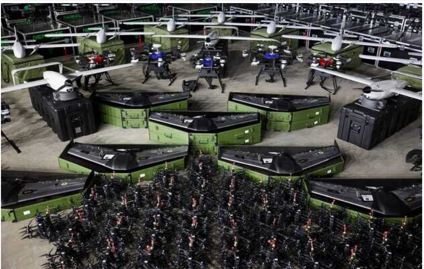
Великобританія надасть Україні 200 мільйонів фунтів на виробництво дронів

Велика Британія виділить 200 мільйонів фунтів стерлінгів на побудування різних типів безпілотних літальних апаратів для української армії.