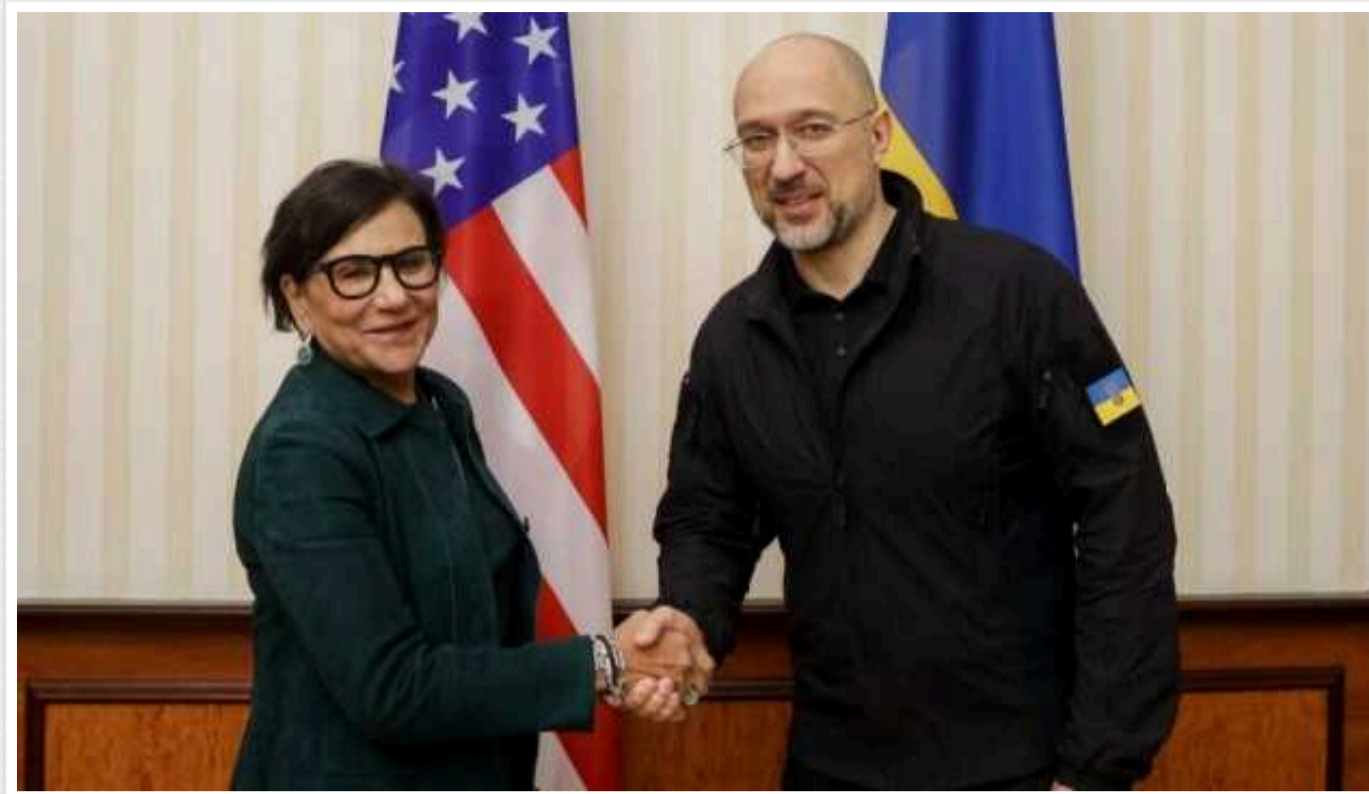
Прицкер та Шмигаль обговорили зміцнення української економіки

Прем'єр-міністр Денис Шмигаль провів зустріч зі спеціальною представницею США з питань економічного відновлення України Пенні Прицкер та американськими бізнесменами.