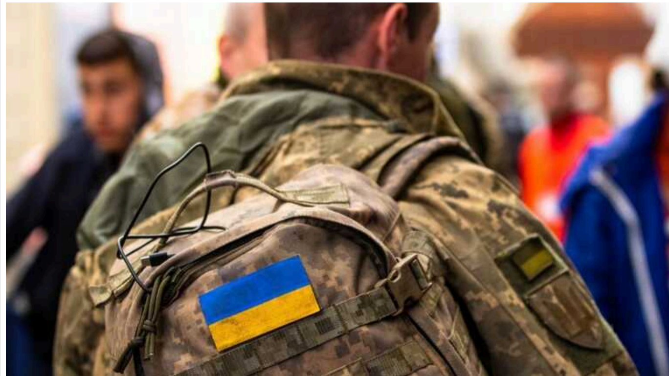
В Одеському ТЦК підтвердили рейди у громадському транспорті з метою мобілізації

"На території, на якій діє військовий стан, військове командування може встановлювати особливий режим в'їзду та виїзду, обмеження свободи пересування громадян, іноземців та осіб без громадянства, а також руху транспортних засобів та перевірку документів в осіб, а у разі потреби проведення огляду речей, транспортних засобів, багажу та вантажів, службових приміщень та житла громадян, за винятком обмежень, встановлених Конституцією України", - йдеться у повідомленні військового командування.