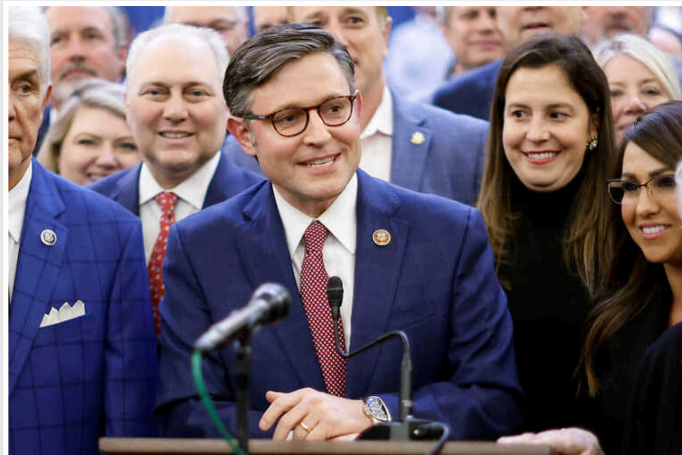
Демократи відкинули умову спікера Палати представників США Майка Джонсона щодо виділення допомоги Україні, - The Hill

Джонсон заявляв, що республіканці виступатимуть проти будь-якої нової допомоги Києву, якщо угода не включатиме жорстких імміграційних обмежень та продовження будівництва стіни з Мексикою.