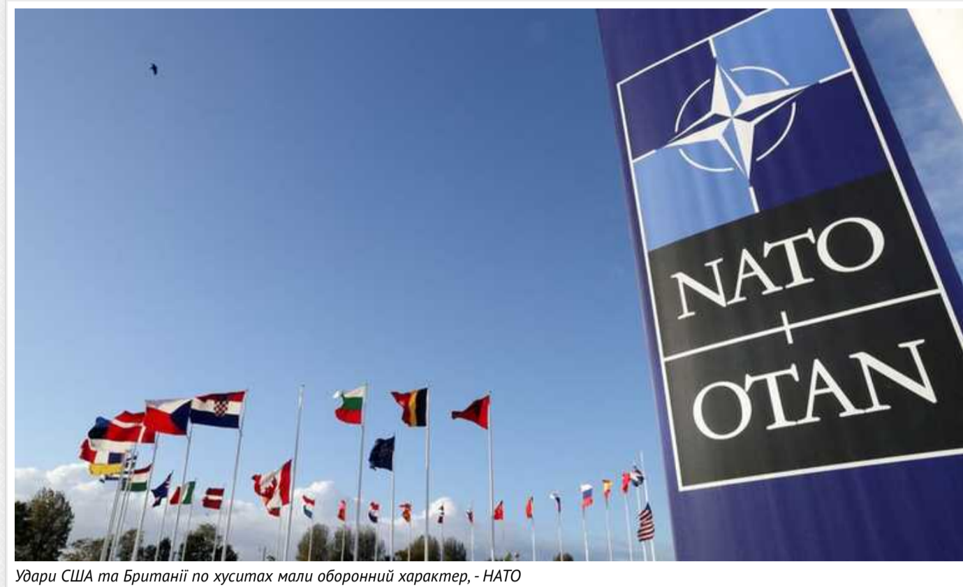
Удари США та Британії по хуситах мали оборонний характер, - НАТО

Удари американських і британських військових по підтримуваних Іраном хуситах в Ємені були оборонними та спрямовані на збереження свободи судноплавства на одному з найважливіших водних шляхів у світі.