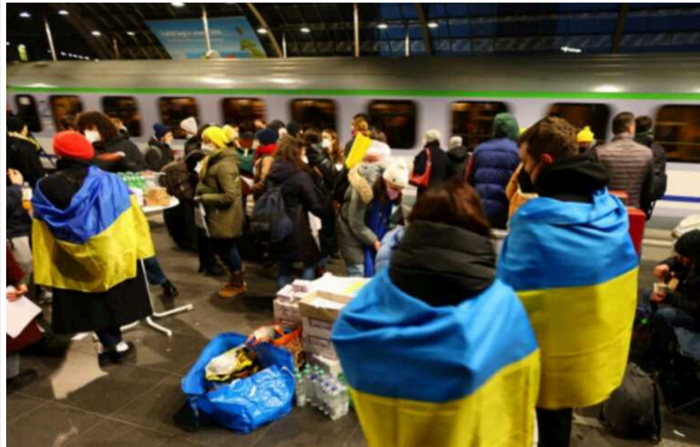
Ірландія не відправлятиме біженців з України додому, поки не закінчиться війна, - прем'єр-міністр Варадкар

Ірландія пообіцяла не відправляти українських біженців додому, поки не закінчиться повномасштабна агресія Росії проти нашої держави й поки це не буде безпечно.