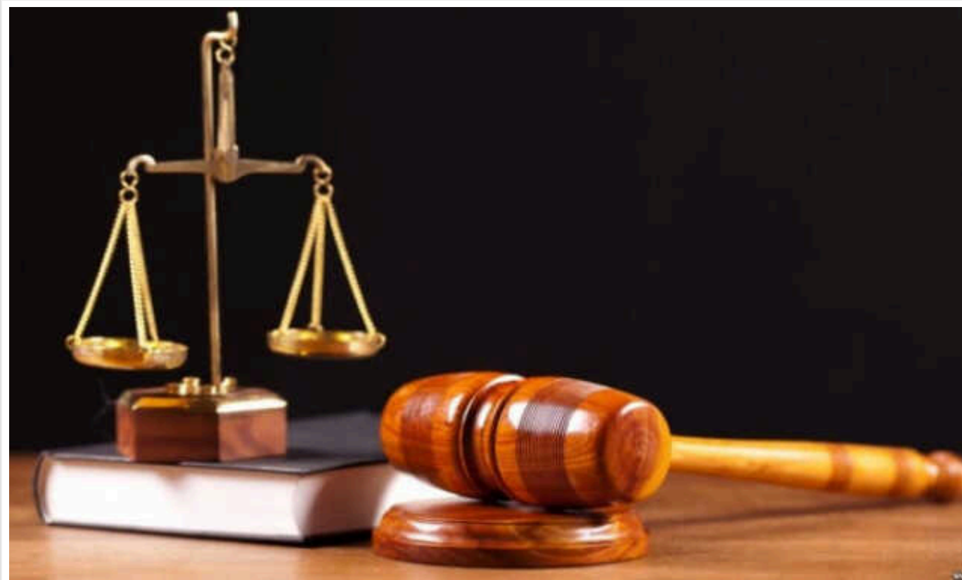
Бучанська прокуратура вимагає повернути у держвласність приватизовані котельні у Коцюбинському на суму 5,5 мільйона гривень

Бучанська окружна прокуратура в судовому порядку повертає у державну власність незаконно приватизовані котельні у селищі Коцюбинське.