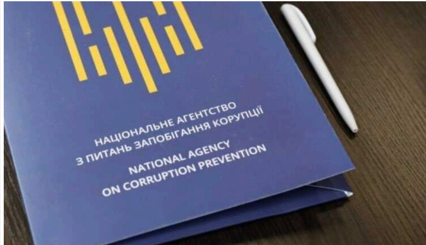
Відсоток українців, визнаних непридатними, удвічі перевищив показник 2021 року, - НАЗК

Національне агентство з питань запобігання корупції (НАЗК) збирано і систематизувало інформацію щодо організації діяльності військово-лікарських комісій (ВЛК) для проведення комплексного дослідження корупційних ризиків.