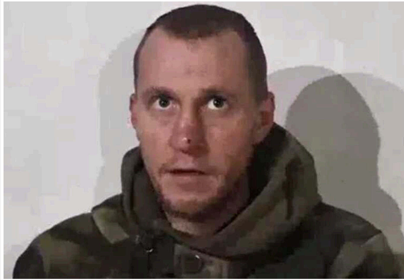
Окупант поскаржився на командування РФ і розповів, чому здався у полон: "Кинули без їжі, БК та води"

Черговий російський окупант, який потрапив у полон до українських захисників, поскаржився на командування РФ. Загарбників кинули без їжі, БК та води, а також без підмоги.