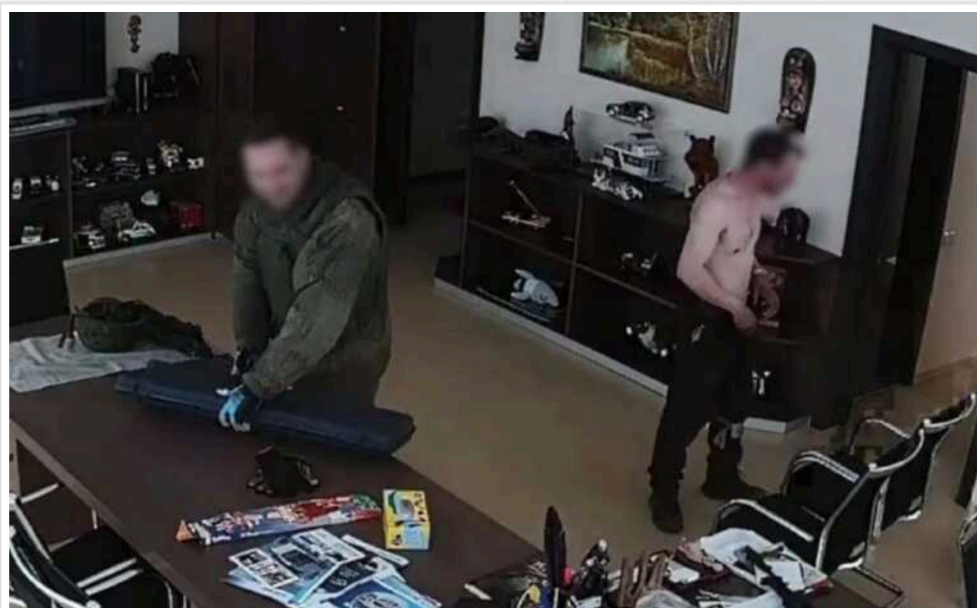
Довічне ув'язнення за вбивство на Київщині: суд засудив окупанта, який пострілами у спину вбив двох цивільних

В Україні суд визнав винним військовослужбовця РФ у воєнному злочині. Окупант вбив пострілами у спину двох мирних мешканців біля села Мрія на Київщині.