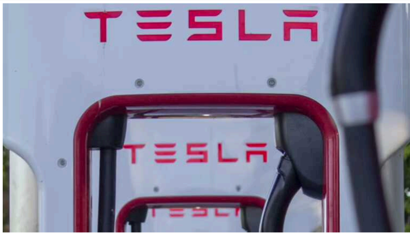
Tesla зупиняє виробництво в Берліні через атаки у Червоному морі: геополітична нестабільність впливає на виробництво електрокарів

Виробник електрокарів Tesla Ілона Маск призупинить виробництво більшості автомобілів на своєму заводі поблизу столиці Німеччини Берліна на 2 тижні через атаки на Червоному морі.