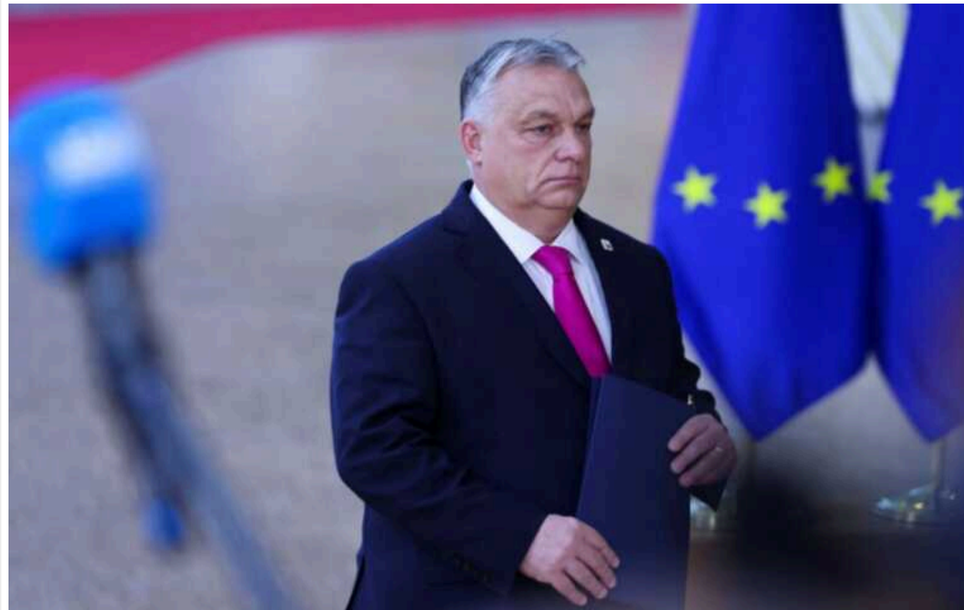
Politico: Угорщина запропонувала "компроміс" для зняття вето на 50 мільярдів євро для України

Угорщина дала зрозуміти, що може зняти в Євросоюзі вето на виділення Україні 50 млрд євро, якщо фінансування переглядатиметься щороку.