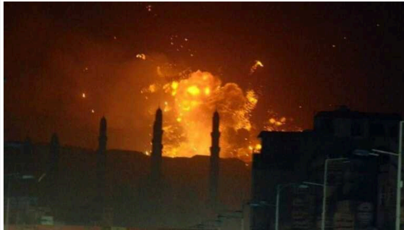
Після ударів США по хуситах у Ємені, у світі різко зросли ціни на нафту, – Bloomberg

Аналітики зазначають, що вартість світового еталонного сорту нафти Brent зросла на 2,5% і перевищила 79 доларів за барель. Головний ризик полягає в тому, що Іран буде безпосередньо втягнутий у збройний конфлікт.