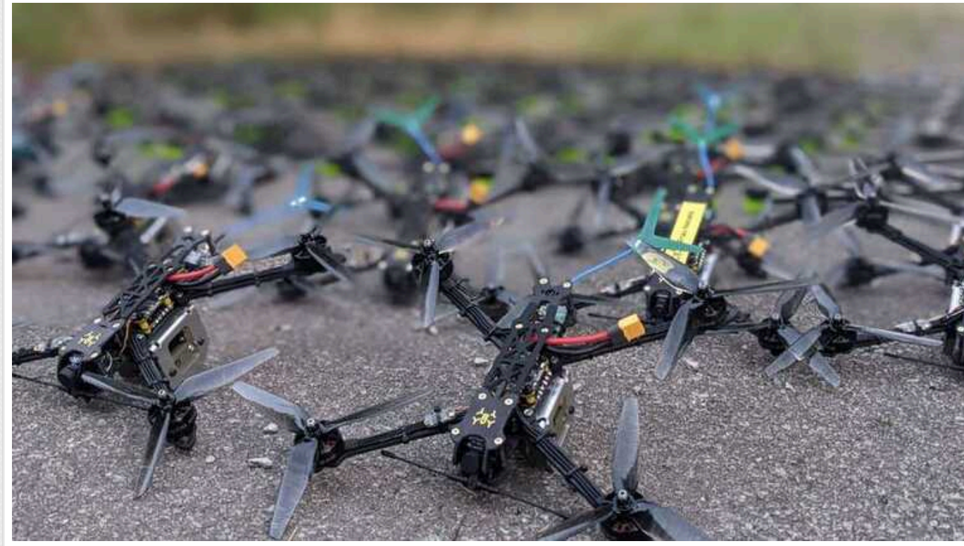
Латвія очолила "коаліцію дронів" для допомоги ЗСУ

Під час візиту Президента України Володимира Зеленського до Риги було ухвалено рішення про те, що Латвія, як країна-союзник, займеться лінією БПЛА в межах меморандуму про військове співробітництво.