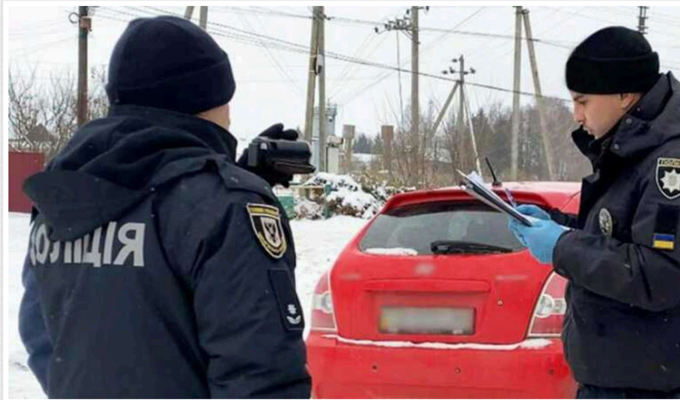
На Чернігівщині поліція затримала підозрюваних в умисному вбивстві: вбили за трактор і сховали тіло в лісосмузі

Поліцейські затримали двох жителів міста Мена на Чернігівщині, яких підозрюють в умисному вбивстві підприємця та заволодінні його трактором.