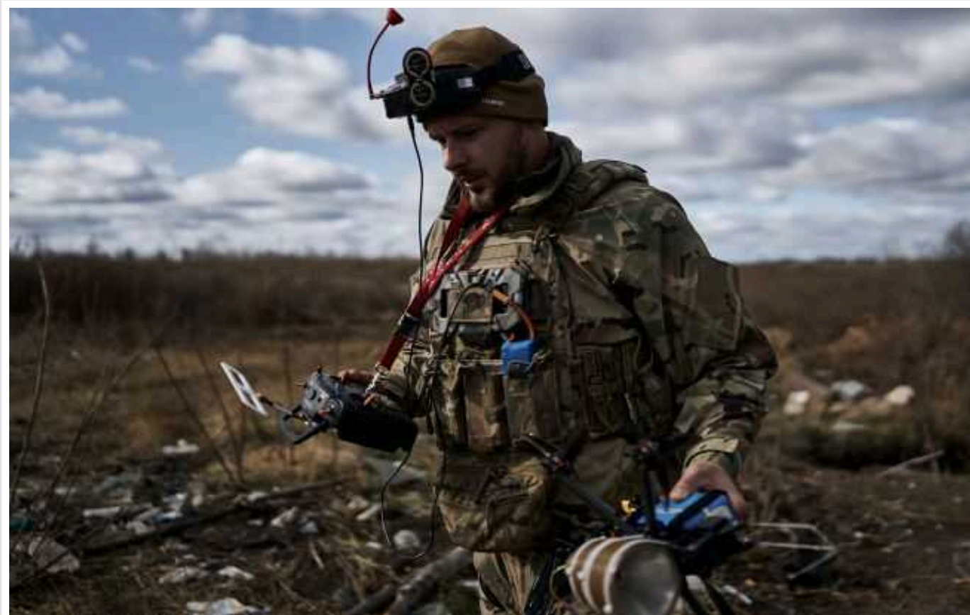
Британська розвідка: Російська армія безсила перед українськими дронами на лівому березі Дніпра

Російська армія зазнає великих втрат через удари артилерії та дронів, які прикривають український плацдарм у Кринках на лівому березі Дніпра.