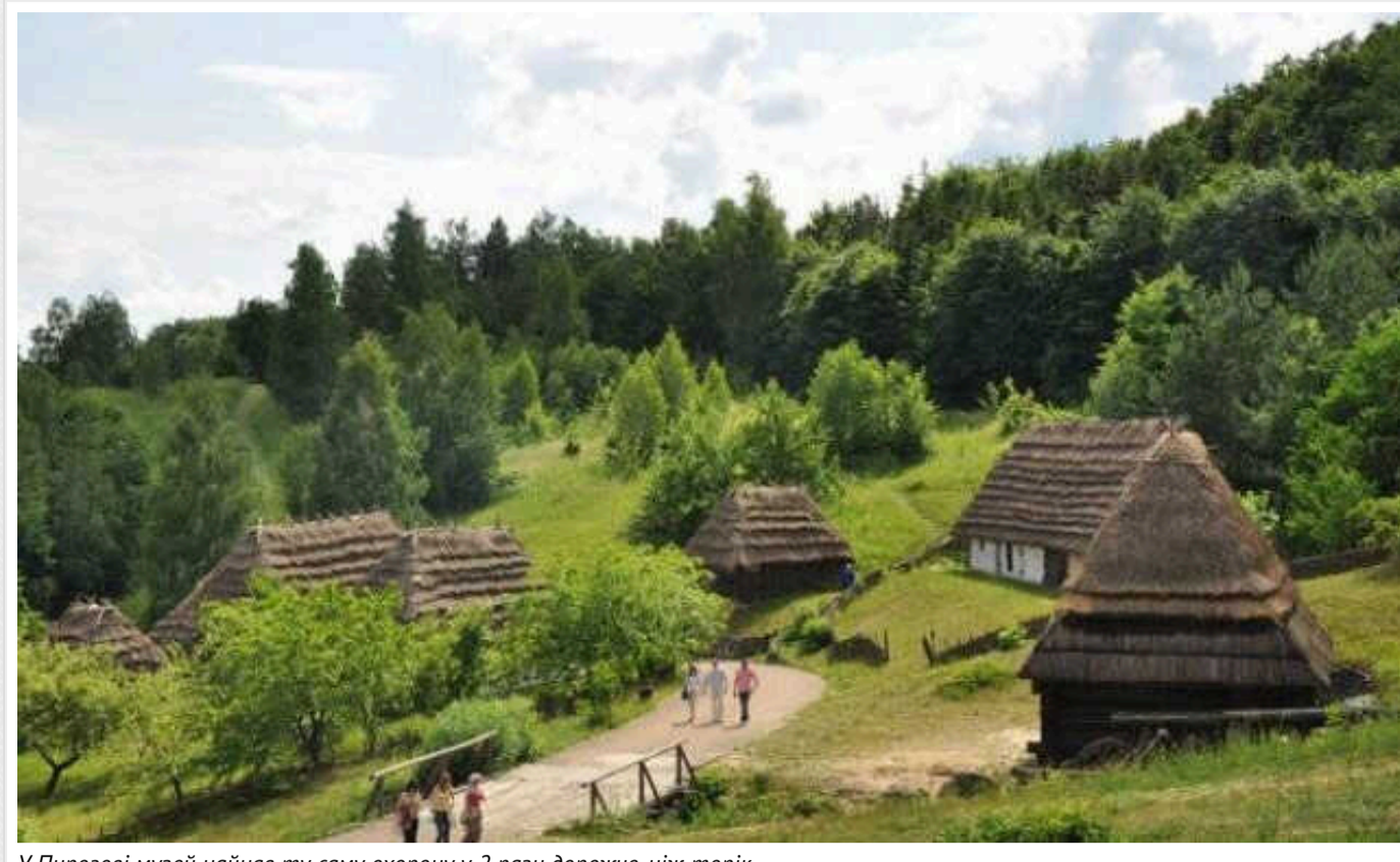
У Пирогові музей найняв ту саму охорону у 2 рази дорожче, ніж торік

Національний музей народної архітектури та побуту України 3 січня за результатами тендеру замовив Українсько-польському спільному підприємству «Макрохем-Україна» послуги з охорони на 21 млн грн.