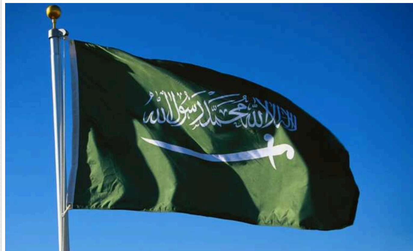
Саудівська Аравія закликала до стриманості в питанні Ємену

Королівство Саудівська Аравія, яке в останні місяці брало участь у мирних переговорах з єменськими хуситами, закликала до стриманості та "уникнення ескалації" у світлі повітряних ударів, завданих Сполученими Штатами та Великою Британією по об'єктах, пов'язаних з рухом хуситів у Ємені.