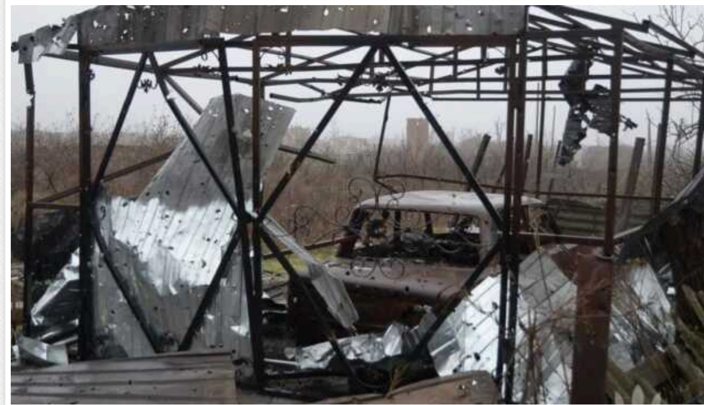
Окупанти за добу атакували 9 областей України, – звіт ОВА