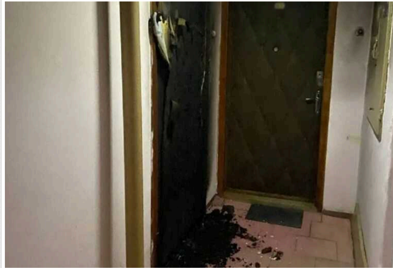
У Києві судитимуть чоловіка, який через ревності підпалив двері квартири колишньої дівчини

У Києві судитимуть чоловіка, який через помсту підпалив двері колишній дівчині. Так ревнивець відреагував на те, що вона почала зустрічатись з іншим.