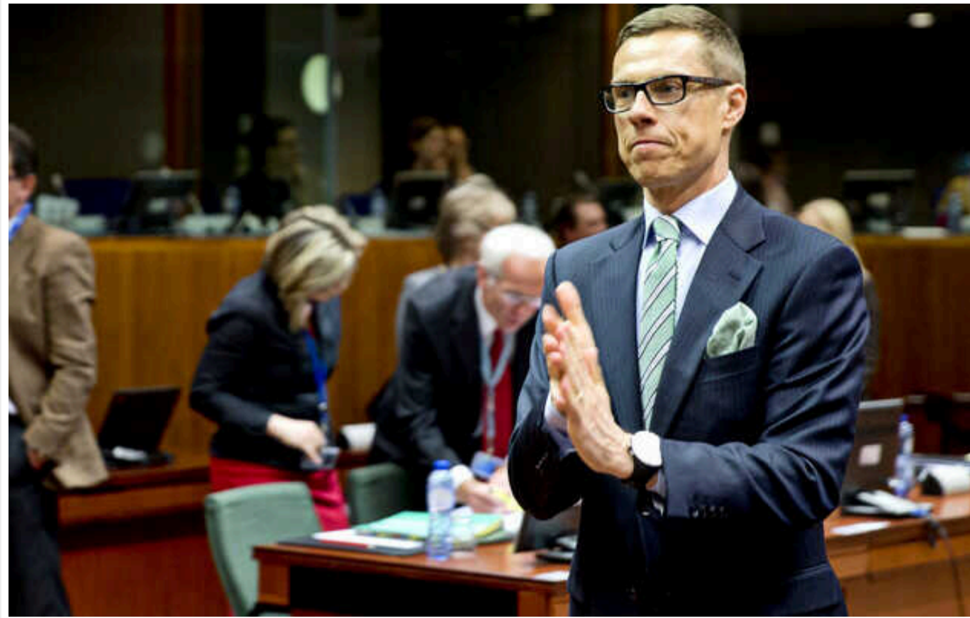
У Фінляндії лідер президентських перегонів обіцяє не мати жодних справ з Росією

Колишній прем'єр-міністр Фінляндії Александр Стубб, який наразі лідирує у президентському рейтингу, заявив, що не буде підтримувати жодні відносини з РФ, поки Кремль не припинить війну проти України.