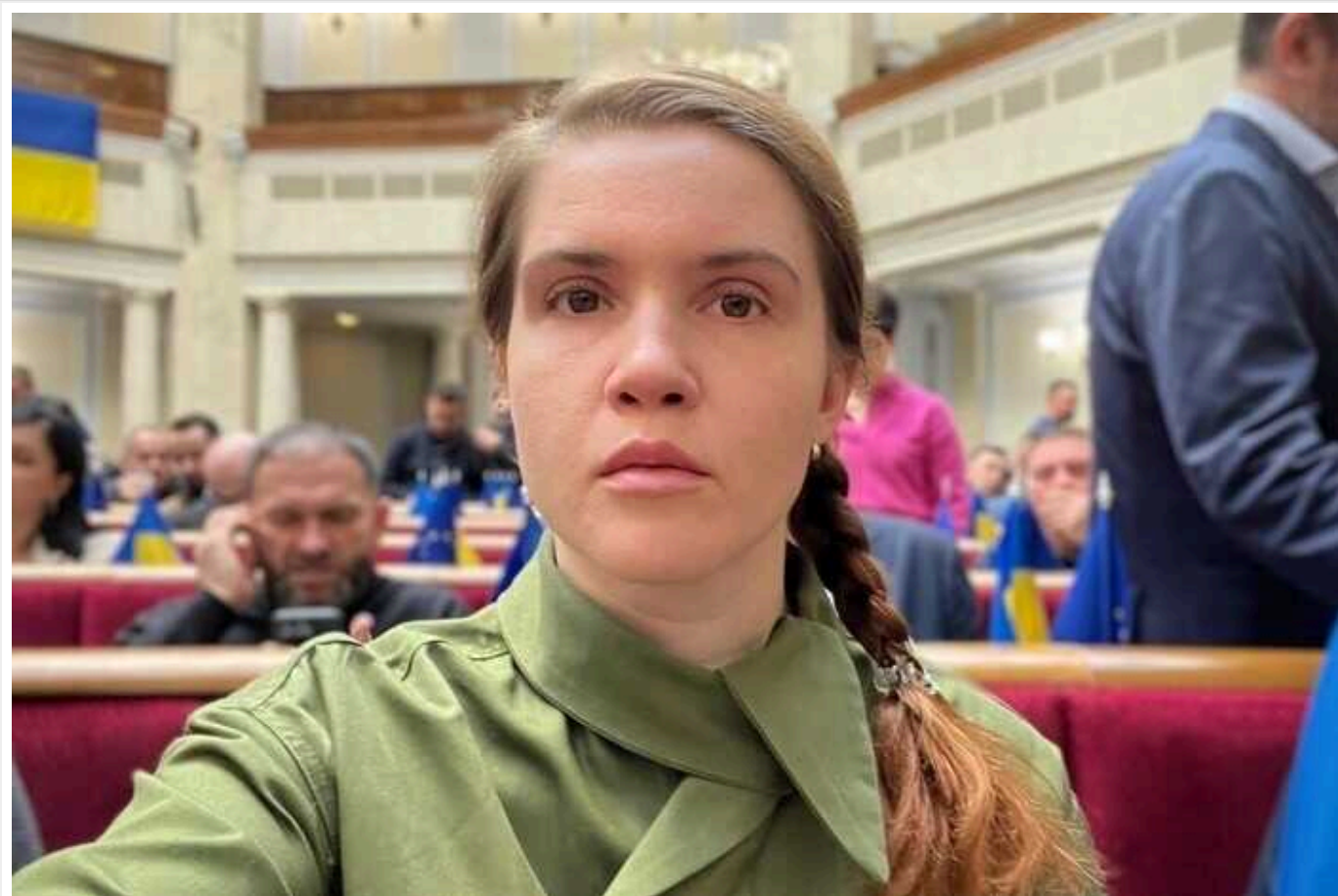
Виключити відстрочку чинним народним депутатам України: нардеп Безугла прокоментувала зміни законопроекту про мобілізацію

Читати на руском Додати як бажане джерело в Google