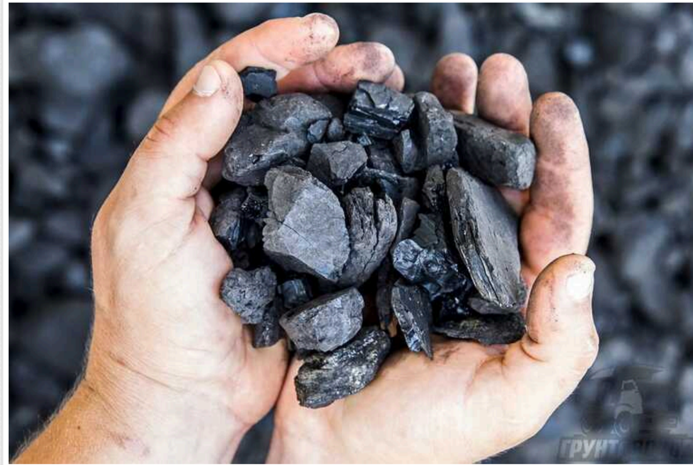
Окупанти пропонують жителям окупованих територій вугілля в обмін на російський паспорт, – ЦНС

Російські загарбники пропонують жителям тимчасово окупованих територій Херсонської області видати вугілля, якщо люди погодяться отримати паспорт РФ.