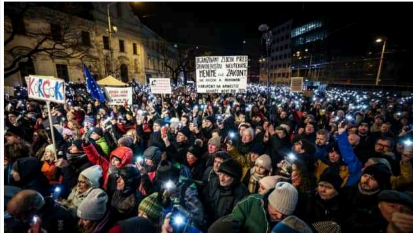
У Словаччині тисячі людей вийшли на протести проти уряду Фіцо

Тисячі людей вийшли напередодні увечері на вулиці великих міст Словаччини проти планів нового уряду на чолі з прем'єром Робертом Фіцо внести зміни до кримінального законодавства.