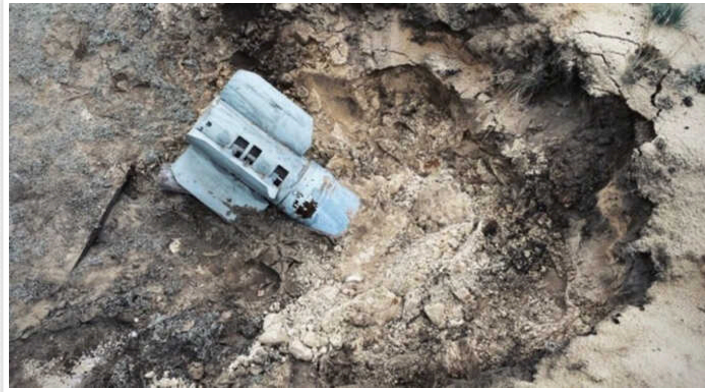
Російські війська минулої доби випустили по Херсонщині 310 снарядів: є загиблий і поранені

Минулої доби російські загарбники випустили по Херсонщині 310 снарядів, загинула одна людина.